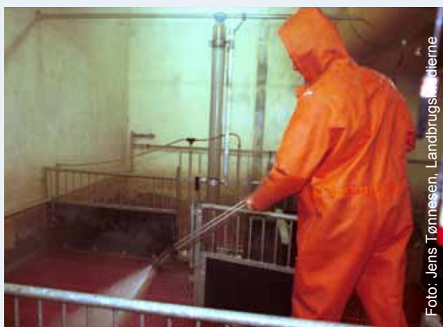
Найгірший бруд що глибоко в'ївся, легше видалити за допомогою насадки під кутом.