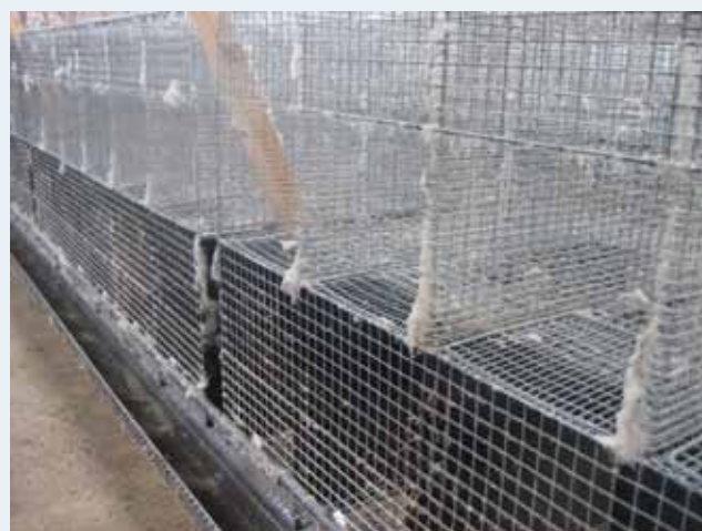
Жмути хутра у клітині норки краще видалити за допомогою турбо-сопла.

Нарешті ви миєте стелі і вироби з дерева. Послідні канали повинні бути повільно змиті начисто від мокрого бруду.