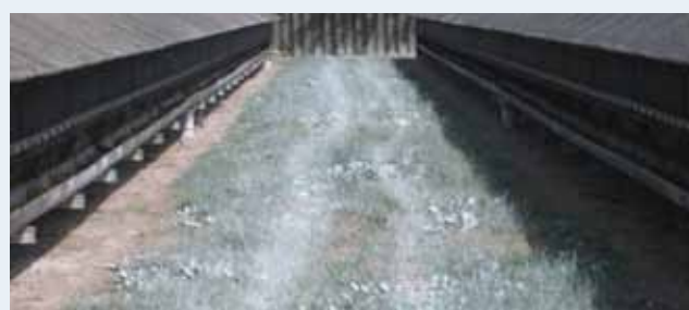
Вапняні суміші дезінfectують землю після очищення

Коли розсадники і клітки сухі ви перевіряєте чи необхідно їх вимити знову. При реорганізації, прибирання повинно бути затверджено ветеринаром до дезінфекції. Плазмодитарні ураження і хутрянні комбінати повинні проходити громадський контроль, в тому числі по очищенню та дезінфекції. Ферми повинні дезінфікуватися 2 рази з як мінімум 1-тижневими інтервалами. Очищення та дезінфекція повинні бути затверджені так званим регіональним продовольчим органом (fødevareregionen). Повинна надаватися документація, в якій зазначається, що використовується для дезінфекції, зовнішня температура того дня, коли проводилась дезінфекція, метод застосування і імена осіб, які виконували дезінфекцію.