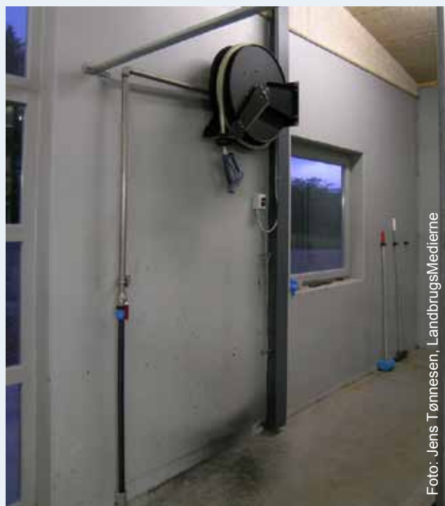
Барабан-катушка для шланги спрощує засіб використання шланги

Дезінфекція є спеціальною дисципліною, яка потребує спеціальних знань та поведінки. При використанні хімічних речовин з символом небезпеки на упаковці, треба ознайомитись з описом застосування. Воно повинно включати дані про безпеку для всіх хімічних речовин, інформацію про засоби індивідуального захисту, правила експлуатації і зберігання, де знайти першу медичну допомогу.